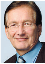
Von Eugen David, Ständerat

Eugen David gehörte zu jener Minderheit im Ständerat, die den UBS-Staatsvertrag mit den USA abgelehnt hat. Die Entscheidung zu dieser wichtigen Frage hat einiges Aufsehen erregt. Im folgenden Beitrag erläutert Eugen David seine Haltung und weist auf die Problematik des Staatsvertrags hin.