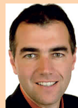
Christophe Darbellay, Nationalrat und CVP-Präsident

Am Samstag, 28. April, besteht die Gelegenheit, Nationalrat und CVP-Präsident Christophe Darbellay am Wahlkampfauftakt der CVP Kanton St.Gallen in der Kantonshauptstadt auf den Zahn zu fühlen. «präzis» spurte mit zwei Fragen vor.